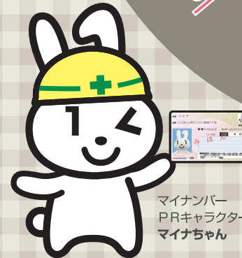
マイナンバー PRキャラクター マイナちゃん